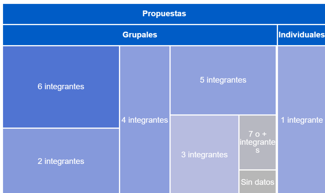
Gráfico 1. Inscripciones por número de integrantes.