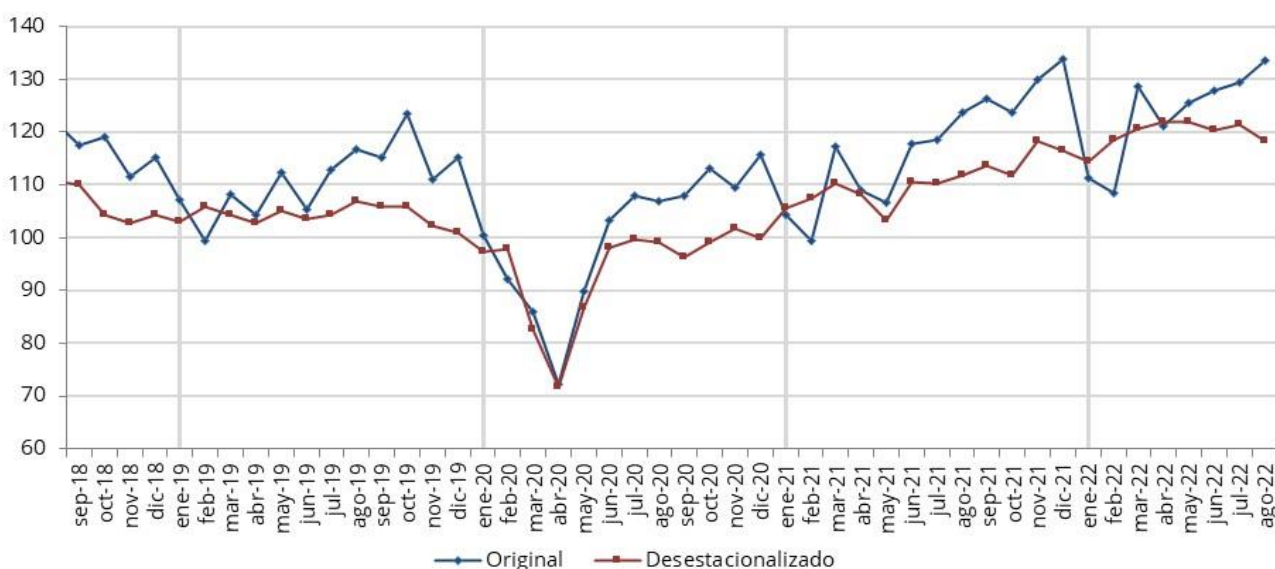
Gráfico 1. Evolución mensual del indicador de facturación a valores constantes (Base enero 2011 = 100). Últimos cuatro años

Nota: En el mes de marzo 2020 se dispuso el ASPO (Aislamiento Social Preventivo y Obligatorio) para mitigar los efectos de la pandemia de COVID-19.