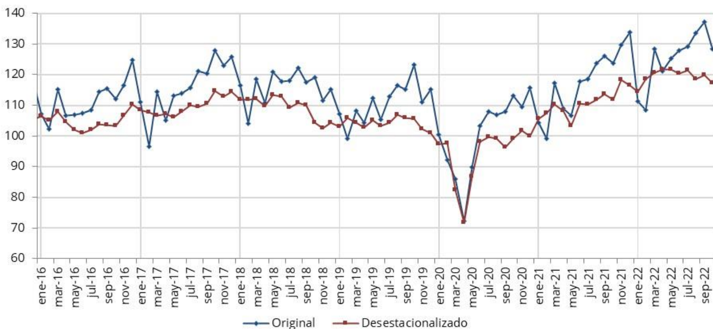
Gráfico 1. Evolución mensual del indicador de facturación a valores constantes (Base enero 2011 = 100). Últimos cuatro años

Nota: En el mes de marzo 2020 se dispuso el ASPO (Aislamiento Social Preventivo y Obligatorio) para mitigar los efectos de la pandemia de COVID-19.