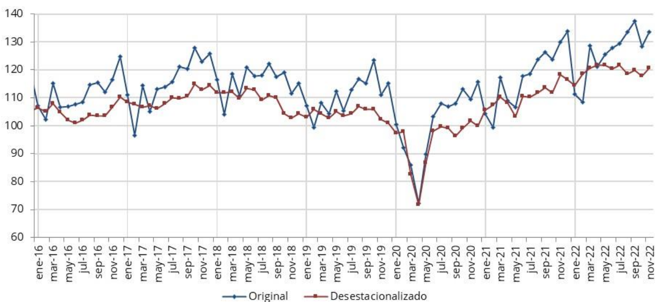
Gráfico 1. Evolución mensual del indicador de facturación a valores constantes (Base enero 2011 = 100). Últimos cuatro años

Nota: En el mes de marzo 2020 se dispuso el ASPO (Aislamiento Social Preventivo y Obligatorio) para mitigar los efectos de la pandemia de COVID-19.