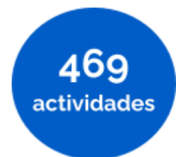
Gráfico 1. Actividades sobre Artes Escénicas, por disciplina artística. Año 2022.

En el gráfico que se observa a continuación se puede apreciar el peso porcentual de cada una de las disciplinas artísticas en el número agregado de actividades vinculadas a las Artes Escénicas.