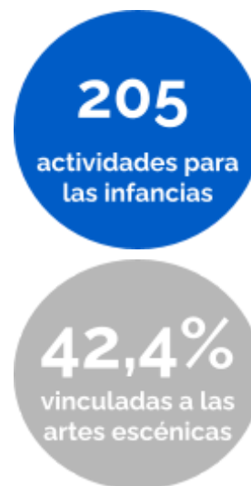
Gráfico 1. Actividades relativas a las infancias, por tipo. Año 2022

En ese sentido, podemos mencionar programaciones que sobresalieron tales como "Ciclo de títeres con buen y mal tiempo", un ciclo de teatro y títeres a la gorra. Por otra parte, también ocupó un lugar destacado la programación en el marco de "Agosto para las infancias", la cual consistió en una amplia propuesta de actividades en el mes de los niños y niñas.