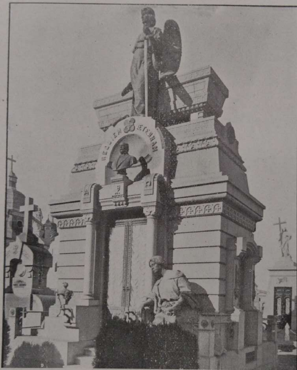
EN EL CEMENTERIO SAN SALVADOR

Con la misma organización y análogos fines están constituidas las sociedades Damas de Caridad y Damas de Misericordia . La primera tiene á su cargo el sostenimiento del Asilo de Huérfanos y la segunda el Asilo Maternal, respecto á cuyos establecimientos pueden verse detalles más adelante. Entre estas sociedades debe también incluirse la Sociedad Protectora de Huérfanos , formada por señoritas cuyo objeto es proveer de ropas á los niños del Asilo de Huérfanos.