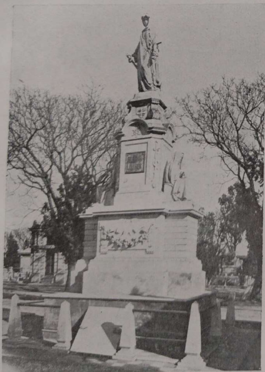
EN EL CEMENTERIO SAN SALVADOR

La asistencia á enfermos indigentes se practica en los consultorios de la casa central ó en el domicilio de los pacientes cuando están imposibilitados de concurrir á ellos. A este servicio están afectados seis médicos que atienden un consultorio policlínico durante todo el día y cuatro especialistas que tienen á su cargo, respectivamente, los consultorios de oftalmología, laringología, piel y venéreas, y ginecología. Existe además un consultorio de odontología y otro de electro-radiología atendidos por profesionales de estos ramos. Las curaciones quirúrgicas, sean de heridos ó de pequeña cirugía, tienen un consultorio por separado. Existe también una partera que presta sus servicios á domicilio. Los mismos médicos del consultorio policlínico, terminadas sus tareas en éste, asisten