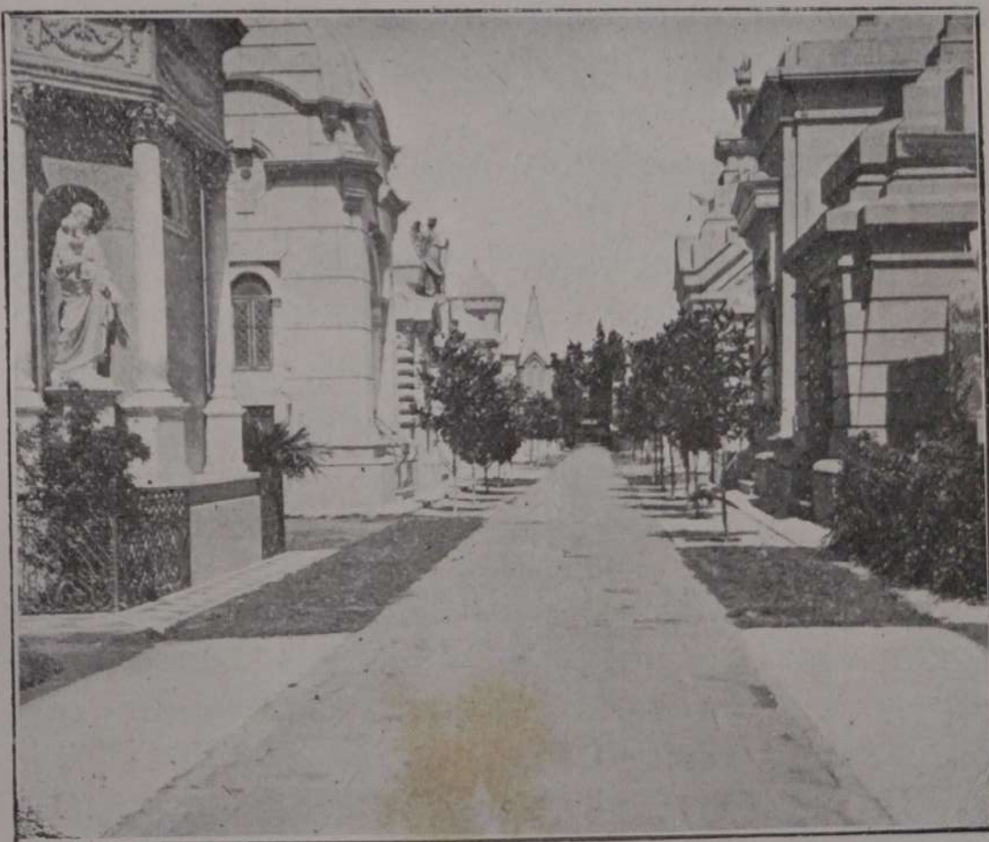
EN EL CEMENTERIO SAN SALVADOR

La sociedad Patronato de inmigrantes italianos , tiene por objeto la protección de estos inmigrantes. Recibe del comité de emigración de Roma una subvención de 30.000 liras, y su acción se desenvuelve bajo la vigilancia de las autoridades diplomáticas italianas. Socorre á los inmigrantes necesitados, buscando trabajo á los desocupados, internando los enfermos en los hospitales, facilitando dinero en efectivo á los indigentes y repatriando á aquellos que no pueden ser auxiliados en mejor forma. Durante el año pasado, 834 inmigrantes han sido socorridos en una ó en otra forma.