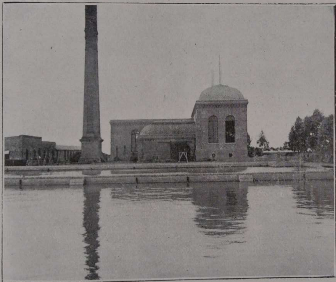
EDIFICIO DE LAS AGUAS CORRIENTES

Antes de la mencionada fecha la población consumía las aguas de lluvia recojidas en algibes, la de los pozos comunes ó de la primera napa, y la del Río Paraná, no filtrada, que distribuían los aguadores.