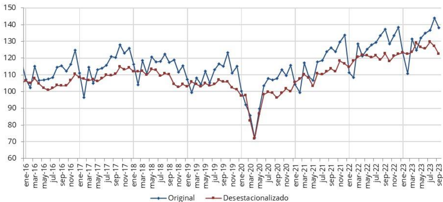
Gráfico 1. Evolución mensual del indicador de facturación a valores constantes (Base enero 2011 = 100). Últimos cuatro años

Nota: En el mes de marzo 2020 se dispuso el ASPO (Aislamiento Social Preventivo y Obligatorio) para mitigar los efectos de la pandemia de COVID-19.