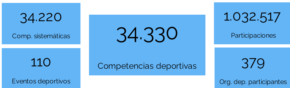
Gráfico 1. Competencias deportivas según mes, año 2023

En este informe se presentan las competencias deportivas relevadas por la Dirección General de Deporte Federado de la Secretaría de Deporte y Turismo de la Municipalidad de Rosario, desarrolladas en Rosario durante el año 2023, analizando variables de interés de las mismas. Dentro de las competencias deportivas realizadas en Rosario se consideran aquellas organizadas por alguna Institución del Deporte Federado, en el marco del cronograma sistemático de cada disciplina, como así también los eventos deportivos, tanto locales, provinciales, nacionales o internacionales desarrollados en dicho período. Se considera participación deportiva a cada intervención distinta de un deportista en una competencia o evento deportivo. Las organizaciones deportivas participantes son clubes, en su gran mayoría de la ciudad de Rosario, y Asociaciones y Federaciones deportivas.